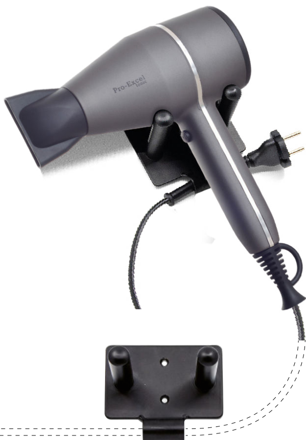
ANTI FURTO Supporto murale "Vane" con ferma-cavo antifurto

Asciugacapelli professionale "hand-held" con supporto murale antifurto "Vane" (optional)